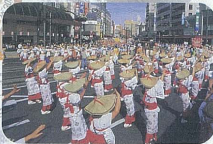
おはら祭り 約60万人の人出がある南九州最大のお祭り。