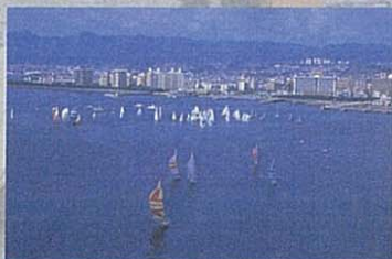
鹿児島カップ火山めぐりヨットレース 南西諸島の火山島を周遊するヨットレース。7月中旬。