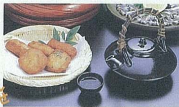
さつま揚げと鹿児島焼酎