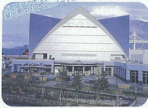
いおワールドかごしま水族館 「南の海と生き物たちの世界」をテーマとした大スケールの水族館。(ジンベエザメが有名)

西郷隆盛や大久保利通をはじめ多くの偉人を輩出した歴史・文化ゾーン等、見どころが多い。