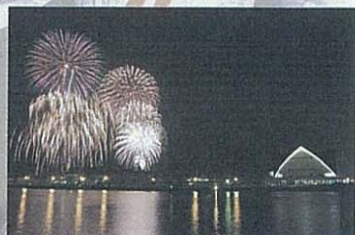
錦江湾サマーナイト花火大会 九州最大級を誇る花火大会。