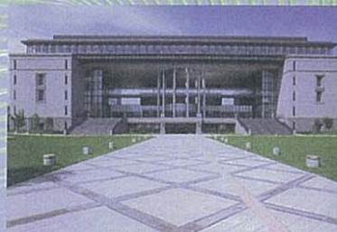
かごしま県民交流センター