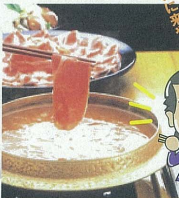
黒豚しゃぶしゃぶ