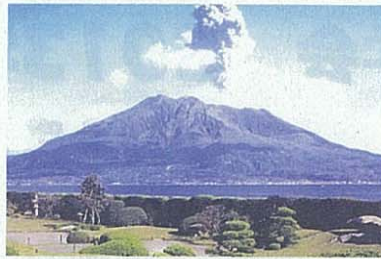
仙巖園(磯庭園) 島津家代々の藩主の別邸。天下の名園といわれている。