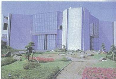
鹿児島市民文化ホール