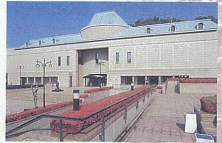
市立美術館 黒田清輝、藤島武二、和田英作など、鹿児島出身で近代画壇をリードした巨匠の絵を多数展示。