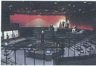
維新ふるさと館 ハイテク演出により明治維新のドラマチックな歴史を体感できる。