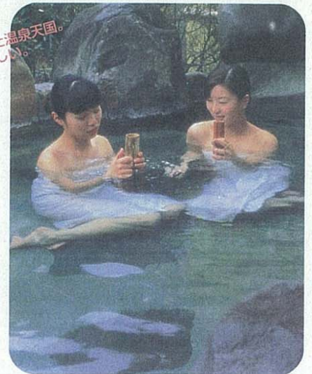
温泉 鹿児島市内の源泉数は約280、県庁所在地では日本一の数。市内の銭湯はほとんどが天然温泉という、温泉好きにはたまらない温泉天国。